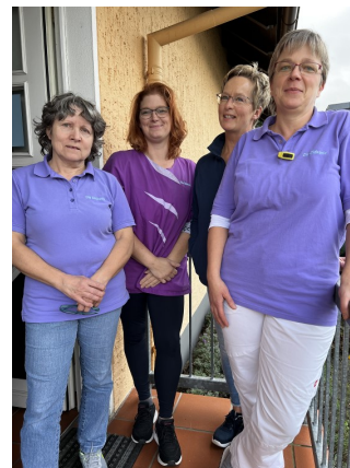
Text: Michael Weber

Leider musste die Diakonie Insolvenz anmelden. Dadurch können das nicht mehr sanierungsfähige Gebäude am Kirchplatz in Lübbecke abgegeben und hoffentlich die Pflegedienste und das Matthäusheim gehalten werden. Hinter der Diakonie stehen aber viele Menschen, die wir deutlich machen wollen: