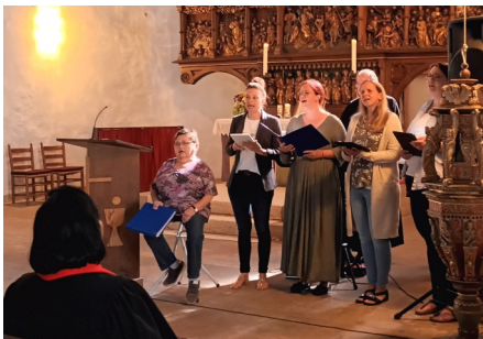
return in action