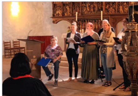
return in action